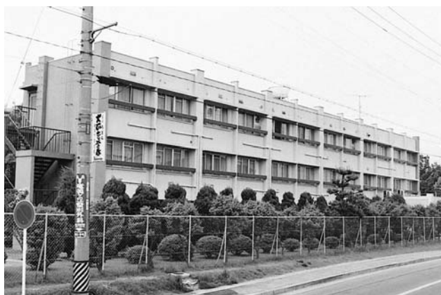
山手ロッジ Yamate Lodge