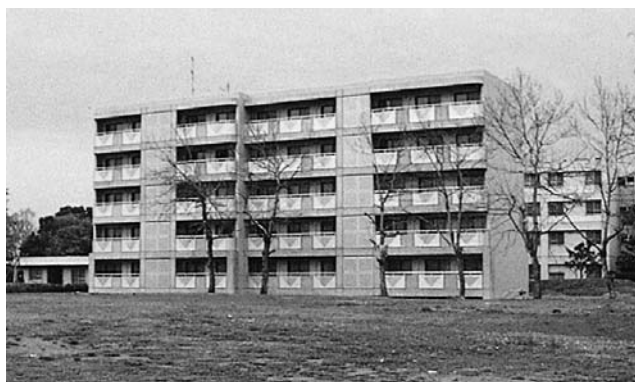
三島ロッジ Mishima Lodge