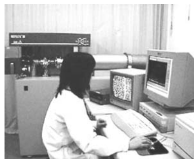
質量分析装置(分析室)

About 70 kinds of analytical equipments (biological, physical, chemical and optical) are available. The room serves for amino acid sequence analysis, and chemical syntheses of peptides to support researchers in two institutes.