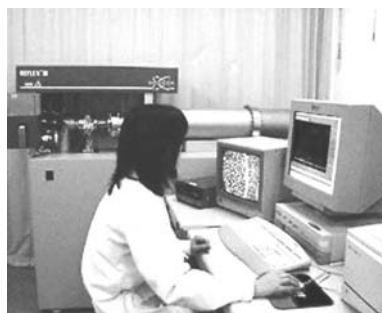
質量分析装置（分析室）

About 70 kinds of analytical equipments (biological, physical, chemical and optical) are available. The room serves for amino acid sequence analysis, and chemical syntheses of peptides to support researchers in two institutes.