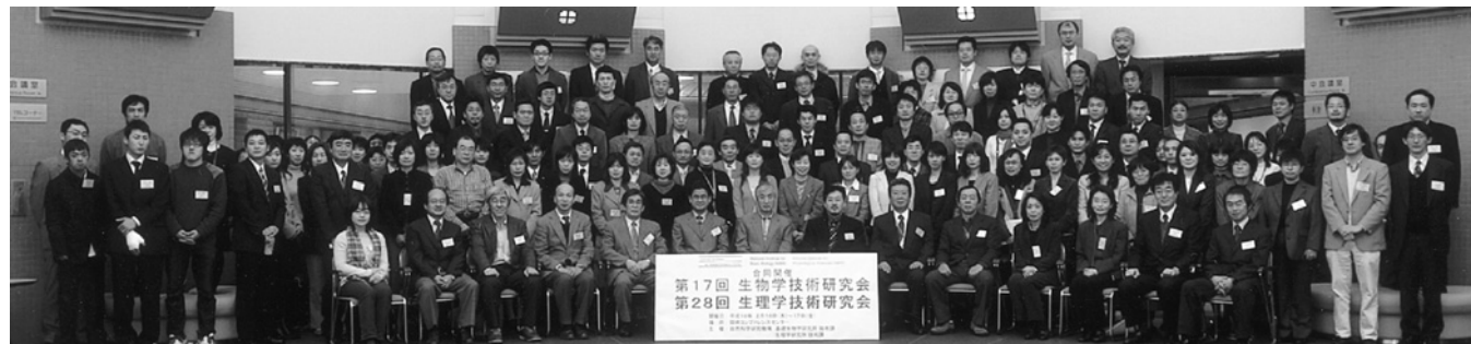
Annual Meeting of Technical Research

These study activities and technical research meetings conducted at the Technical Division are summarized and published in "Annual Report of Technical Division" and in "Annual Report of Technical Research Meeting."