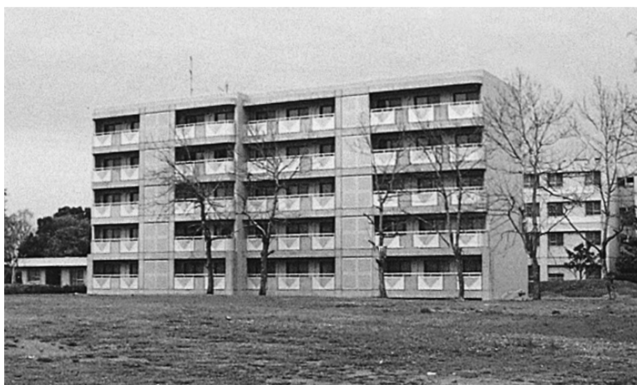
三島ロッジ Mishima Lodge