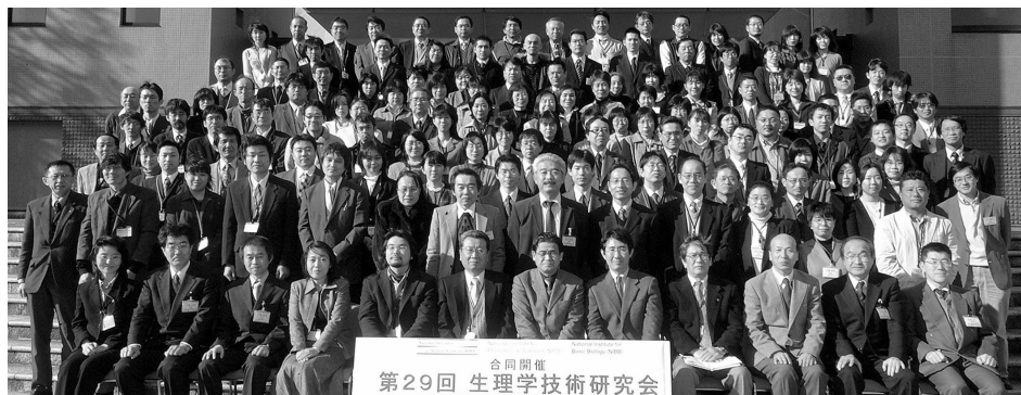
Annual Meeting of Technical Research

These study activities and technical research meetings conducted at the Technical Division are summarized and published in "Annual Report of Technical Division" and in "Annual Report of Technical Research Meeting."