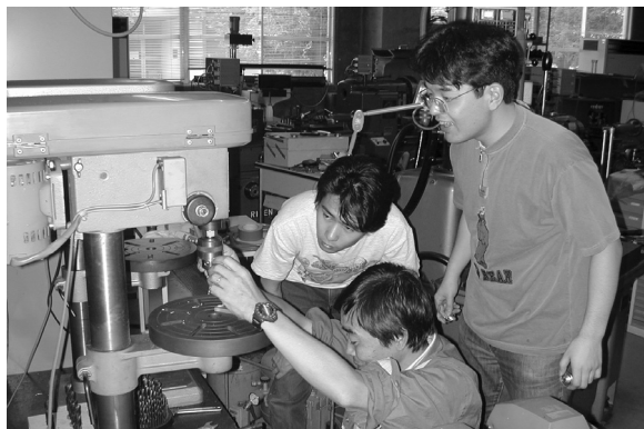
実験機器の開発現場（機器研究試作室） Machine shop for construction of medical and biological apparatuses (Instrument design room)

Custom-designed equipments, which are not commercially available, can be constructed in this room. The machine shop is equipped with various types of machines such as milling machines and drill presses. The electronic shop is equipped with various types of test instruments used for construction and measurement calibration of electronic devices.