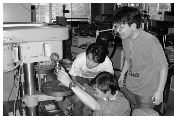
実験機器の開発現場(機器研究試作室) Machine shop for construction of medical and biological apparatuses (Section of Instrument design)

Custom-designed equipments, which are not commercially available, can be constructed in this room. The machine shop is equipped with various types of machines such as milling machines and drill presses. The electronic shop is equipped with various types of test instruments used for construction and measurement calibration of electronic devices.