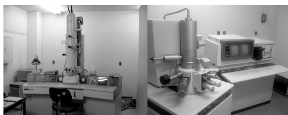
透過型電子顕微鏡(左)、走査型電子顕微鏡(右)(電子顕微鏡室) Transmission and scanning electron microscopy (Section of Electron Microscopy)

Fine structures of tissues, cells or macromolecules can be studied using laser scanning microscopy, and both transmission and scanning electron microscopy in this room. We also provide instruments for picture processing of the observed images.