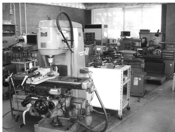
金属加工室の機器(機器研究試作室) Machine shop equipments (Instrument Design Room)

Custom-designed equipments, which are not commercially available, can be constructed in this room. The machine shop is equipped with various types of machines such as milling machines and drill presses. The electronic shop is equipped with various types of test instruments used for construction and measurement calibration of electronic devices.