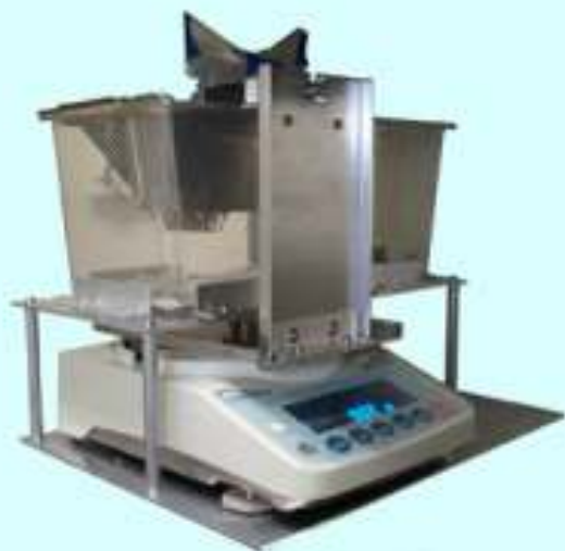
図1 摂水量連続測定装置